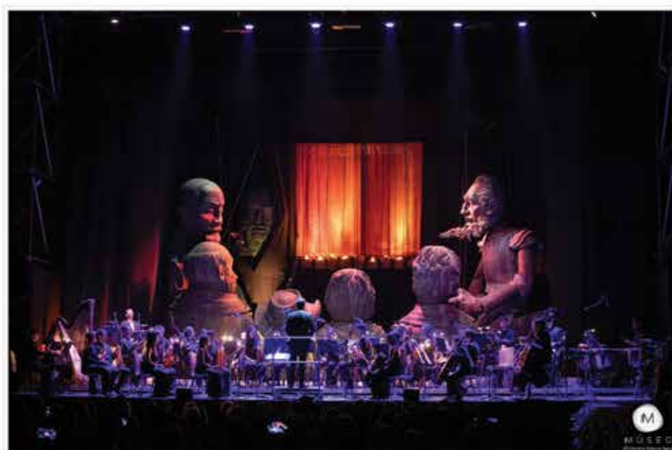
Representación de 'El retablo de Maese Pedro' por la Compañía Títeres Etcétera. MUSEG

La edición 48 del Festival de Música de Segovia ha sido un rotundo éxito tanto por la calidad y variedad de los espectáculos programados, como por la asistencia de público que ha batido el récord de los últimos cinco años, superando en un 20% el anterior, de 2022