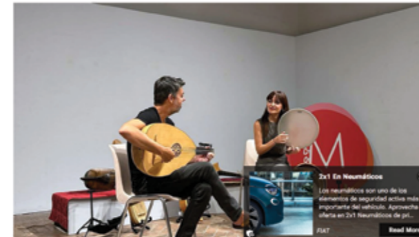
Las edades de la Música se pueden ver en Segovia local

"Las edades de la música" abre, en La Alhóndiga, la 48 edición del Museg