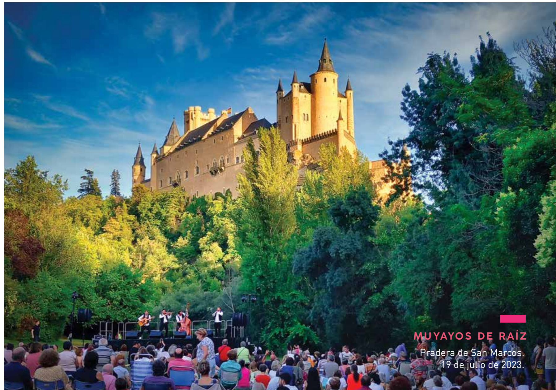
MUYAYOS DE RAÍZ Pradera de San Marcos. 19 de julio de 2023.

Por otro lado, al pie del Alcázar, en la pradera de San Marcos , actuó el peculiar grupo de folk Muyayos de Raíz quienes, desde su formación clásica, exploraron nuevas formas de interpretar música tradicional con un renovado aire fresco.